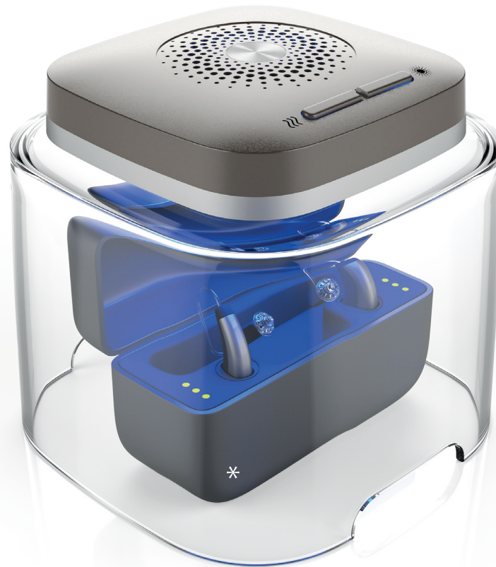
* Geeignet für alle Hörsystem- und Ohrhörer-Ladegeräte